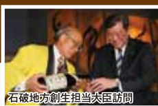
石破地方創生担当大臣訪問

豊富なアイデアを次々と生み出す、 むらづくりの達人。 行政に頼り過ぎない 「むら」起こし実践家。